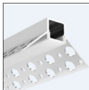
Con cover opalina

Esempio di codice ordine: SLOT-IN-LWH250